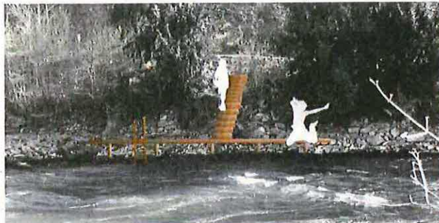
Abbildung 3 Visualisierung