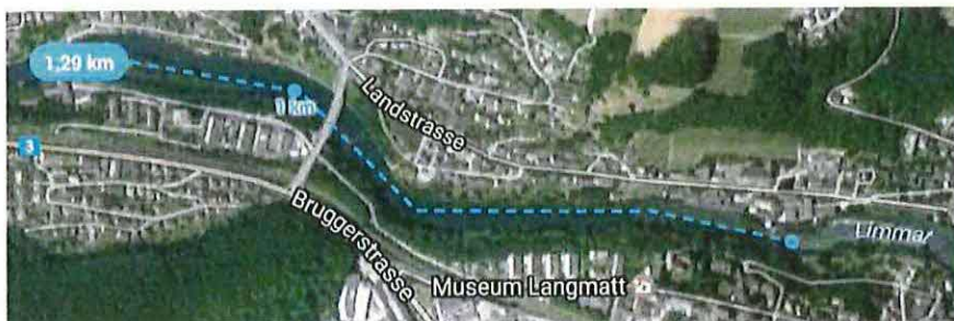
Abbildung 1 Max. Zurücklegbare Strecke Mättelipark - Kappisee

Die Strecke vom Mättelipark bis zum letzten Ausstiegsort, dem Inseli am Kappisee, beträgt rund 1.3 km. Auch einen Einstieg ca. 200m nach den Mättelipark wäre unseres Erachtens sinnvoll.