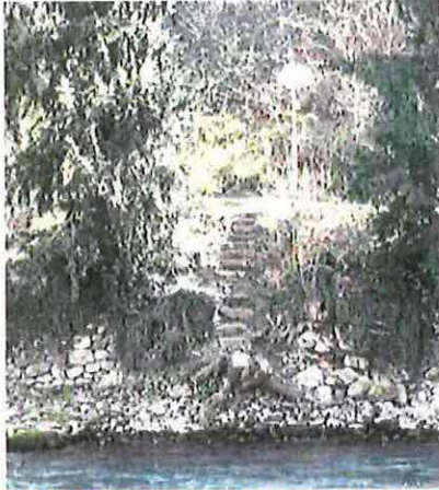
Abbildung 3 Heutige Naturtreppe im Mättelipark