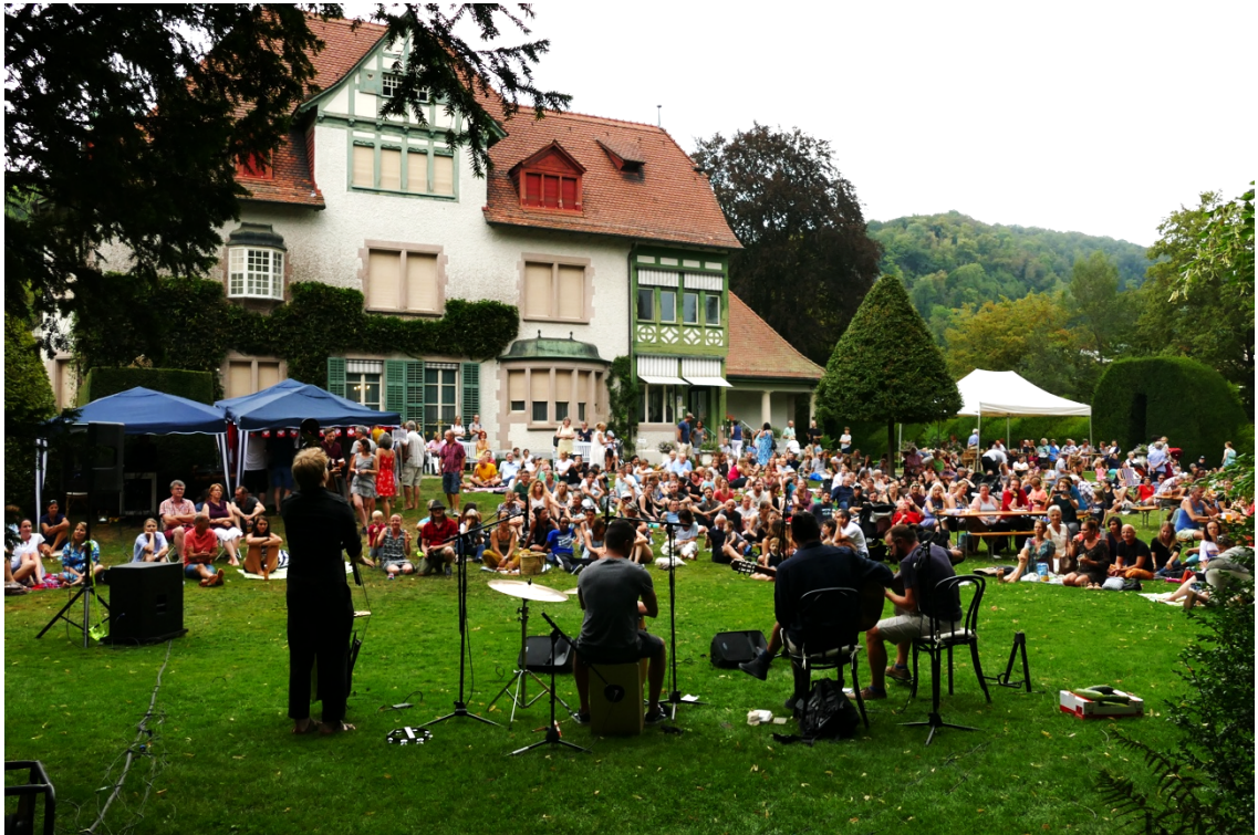
Als «Juwel für alle» zieht die Langmatt ein vielseitiges Publikum in ihren Bann.

Die überregionale und internationale Bedeutung der Langmatt ist mit der Ausrichtung auf eine Teilhabe des Publikums vor Ort nicht infrage gestellt – sie ist mehr denn je bedeutsam. Für die identitätsstiftende Wirkung, die die Langmatt in ihrem unmittelbaren Umfeld vermehrt entfaltet, ist gerade ihre Ausstrahlung und Anerkennung weit über Kantons- und Landesgrenzen hinaus eminent wichtig. Von dem einzigartigen Ensemble aus Park, Villa und Sammlung sowie von der etablierten und immer wieder erfindungsreichen Ausstellungsarbeit geht eine grosse Attraktivität auf das weiter entfernte Publikum sowie auf eine überregionale Berichterstattung in den Medien aus. In der Langmatt wird die in der Stadt Baden gelebte Internationalität greifbar. Diese Reputation bestätigt auch dem Publikum in der Stadt und der Region Baden, welch ein Juwel gleichsam vor der Haustür liegt. Und Stolz auf das Eigene verhindert, dass das Aussergewöhnliche selbstverständlich oder gar belanglos wird.