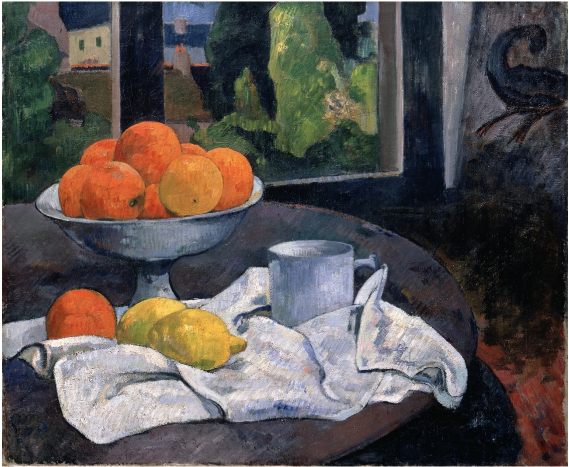
Eines der impressionistischen Meisterwerke in der Sammlung des Museums Langmatt: Paul Gauguin, «Stillleben mit Früchteschale und Zitronen», 1890.