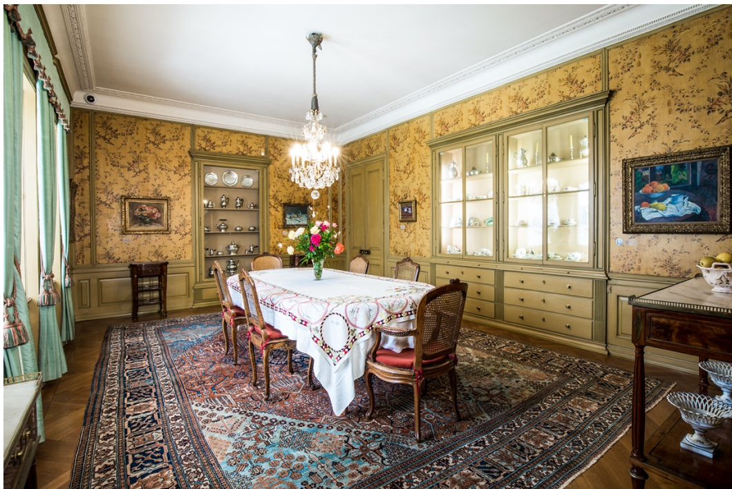
In der Langmatt gehören die historische Wohnsituation, die hochkarätige Kunstsammlung und der Ausblick in den Park untrennbar zusammen.

Der Park, die Sammlung und die Villa (in der die Lebenssituation der Familie Brown, ihre Sammlung und ihr Archiv aus einer zeitgenössischen Position heraus erfahrbar werden) sind integrale, unverzichtbare Bestandteile eines einander in vielfacher Hinsicht bedingenden und stützenden Ganzen. Dieses Ensemble, das vielschichtige Bezüge zwischen der Stadt Baden, dem Kanton Aargau, Industriegeschichte und BBC, Kunst, Architektur und weiteren Aspekten schafft, ist das eigentliche Alleinstellungsmerkmal der Langmatt. Die Auslagerung eines dieser Elemente würde das Ganze schwächen bzw. bis zur Unkenntlichkeit oder Belanglosigkeit verändern. Auch diejenigen Besucher/innen, die nur an einem Teil Interesse haben, schätzen die komplexen Bezüge im Hintergrund und deren Ausstrahlung.