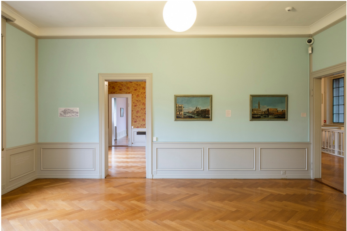
Ausstellungsansicht: «Magisches Venedig – Venezianische Veduten des 18. Jahrhunderts» mit Werken aus der eigenen Sammlung, 2020.