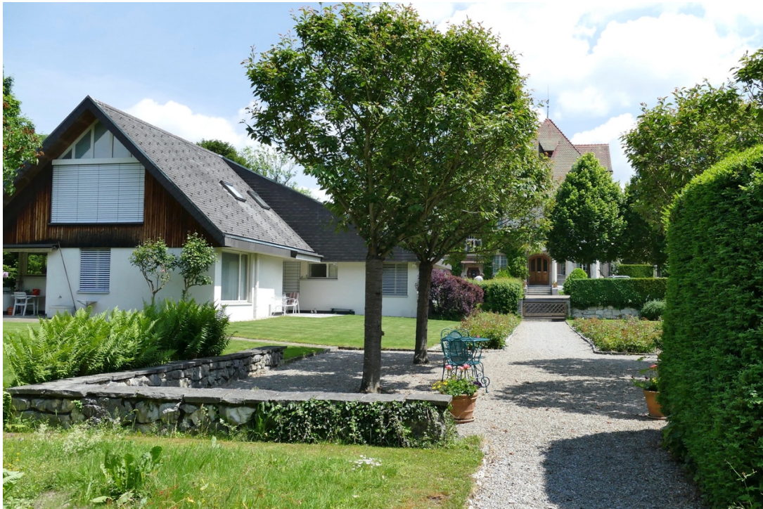
Das Haus Germann (vorne links) würde dem geplanten Pavillon weichen und den Blick auf die Villa Langmatt (hinten) freigeben.

Vor dem Bau des Verwalterhauses war im Teil des Parks, in dem es heute steht, der Stauden- und Naschgarten der Familie Brown angelegt. In seinem Gutachten vom Dezember 2011 erachtet es das mit dem Park bestens vertraute Büro SKK Landschaftsarchitekten (Wettingen) als sinnvoll, diesen Zustand wiederherzustellen. Die kantonale Denkmalpflege kann sich in einer Güterabwägung zwischen der Gebäudesanierung, zu der die Befriedigung von Publikumsbedürfnissen und die verbesserte Wahrnehmung des Denkmals dank des Pavillon-Baus gehört, einerseits, und andererseits der Wiederherstellung des Parks sehr gut vorstellen, dem Museumsbetrieb den Vorrang zu geben. Die Empfehlung: Die Nutzungsergänzung durch den beschriebenen Pavillon im Sinne der Strategie «Juwel für alle» ist dem wieder errichteten Stauden- und Naschgarten vorzuziehen. Für beides gibt es keinen Platz.