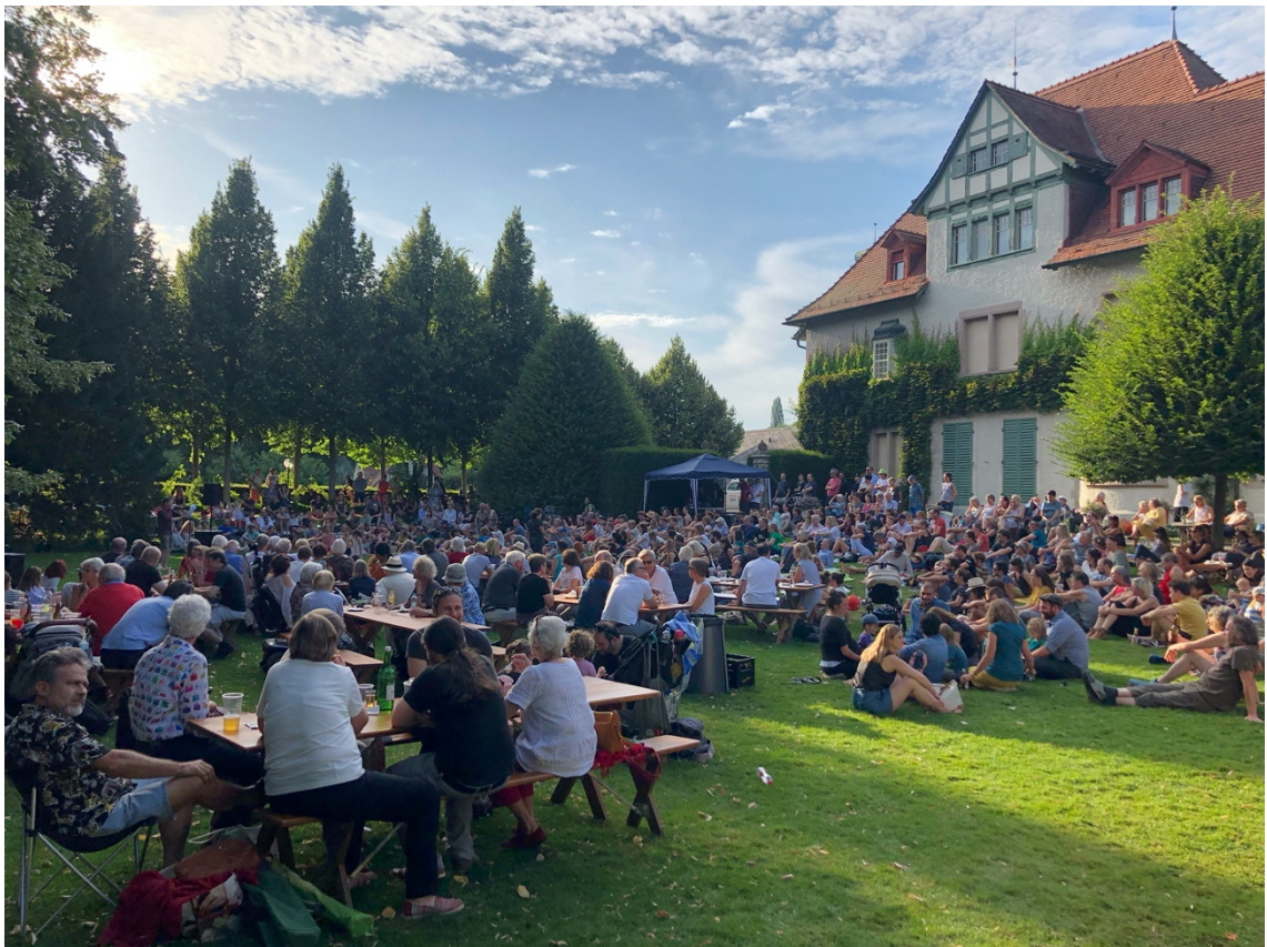
Im Park der Langmatt finden regelmässig öffentliche Veranstaltungen statt – oben: «Picknick im Park», unten: «Poeten zur Lage der Nation».