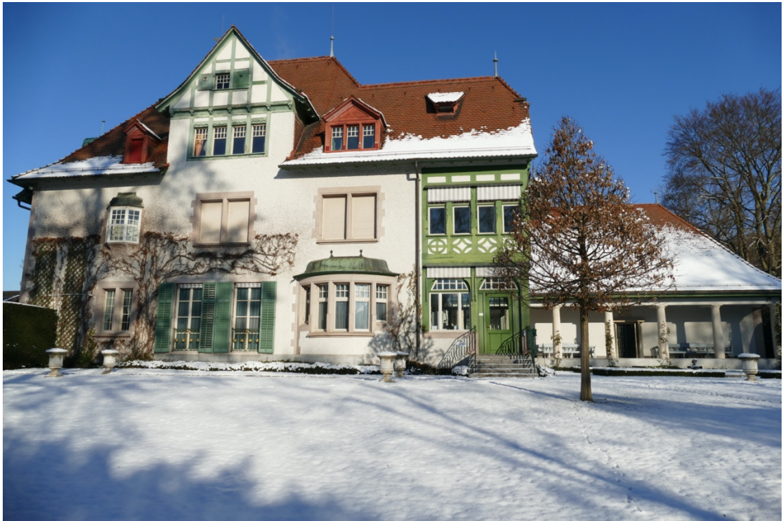
Das Museum Langmatt im Winter.