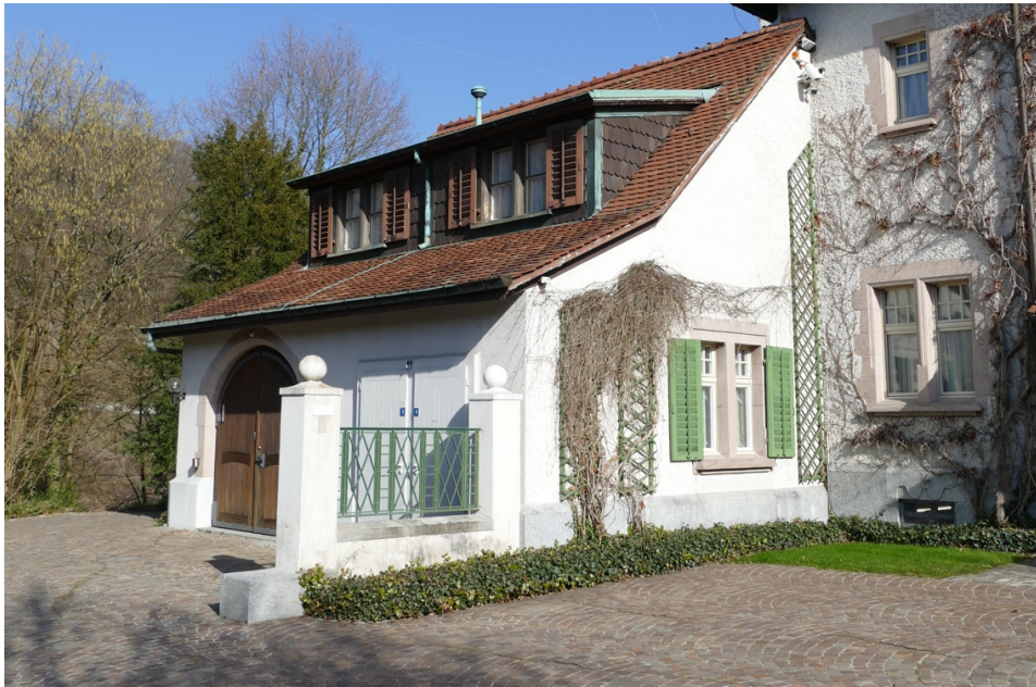
Das Ökonomiegebäude heute; im Soll-Zustand würde es zum Eingangsbereich mit Kasse, Shop, Garderoben und WC's ausgebaut.