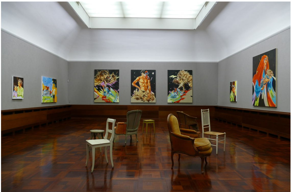
Die Galerie wird für jede Ausstellung individuell eingerichtet. Ausstellungsansicht oben: «Herzkammer – 30 Jahre Museum Langmatt», 2020; unten: «Norbert Bisky – Fernwärme», 2018.