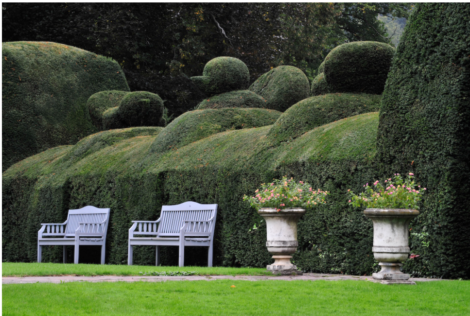
Gartenpflege des Werkhofs der Stadt Baden nach historischen Vorlagen

Unbestritten ist, dass der Park der Langmatt einerseits eine der wichtigsten Gartenanlagen in der Region darstellt und andererseits als zentraler Bestandteil des multi-dimensionalen Langmatt-Ensembles anzusehen ist. Sein derzeitiger Zustand und der fürsorgliche Unterhalt, der vom Werkhof der Stadt Baden geleistet wird, bilden eine solide Basis für die Weiterentwicklung der Langmatt im Sinne des «Juwel für alle».