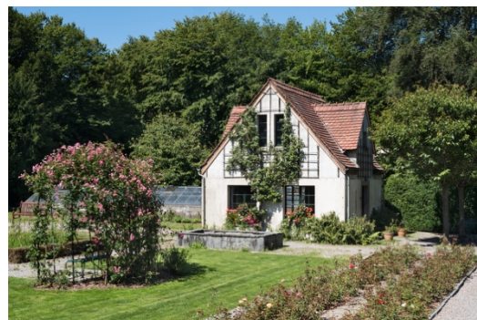
Badehaus und Gärtnerhaus im aktuellen Zustand