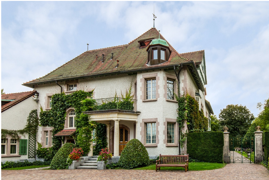
Das Hauptgebäude der Villa Langmatt in Baden

Die Langmatt zählt zu den bedeutendsten Privatsammlungen des französischen Impressionismus in Europa. Wertvoll ist zudem die gesamte Anlage als einzigartiges Ensemble. Dieses Ensemble spiegelt die kunsthistorische Pionierleistung und die luxuriöse Lebensweise der Industriellenfamilie Brown, ermöglicht durch die bei BBC in Baden erarbeiteten Gewinne, und eröffnet vielfältige Bezüge zur Geschichte von Stadt, Region und Kanton.