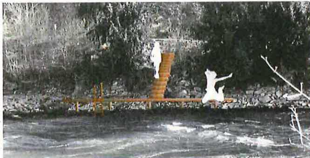
Abbildung 3 Visualisierung