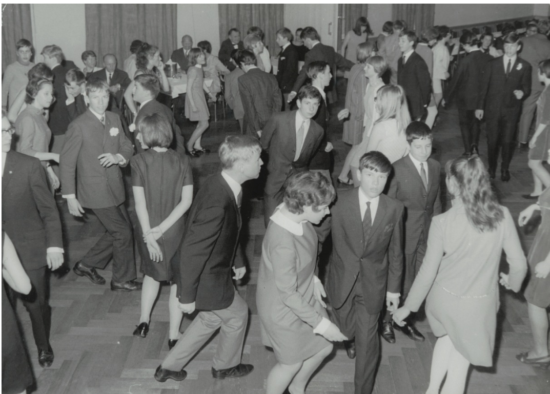
Tanz im Kursaal 1960er