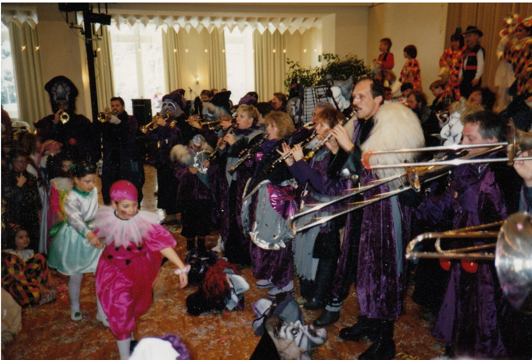
Kinderball im Stadtsaal 1991