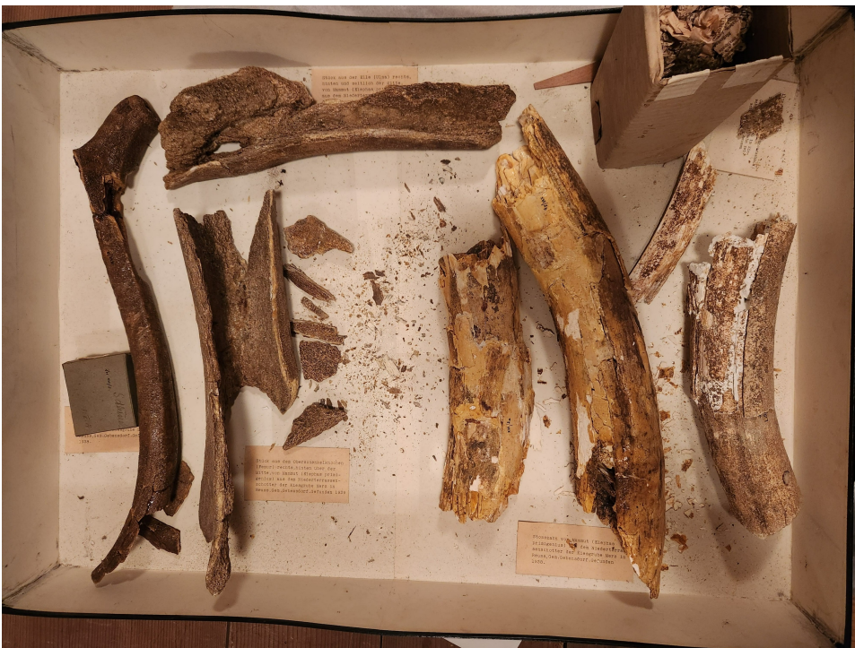
Bildlegende: Ehemalige Lagerung der fragilen Mammutgebeine, ungereinigt