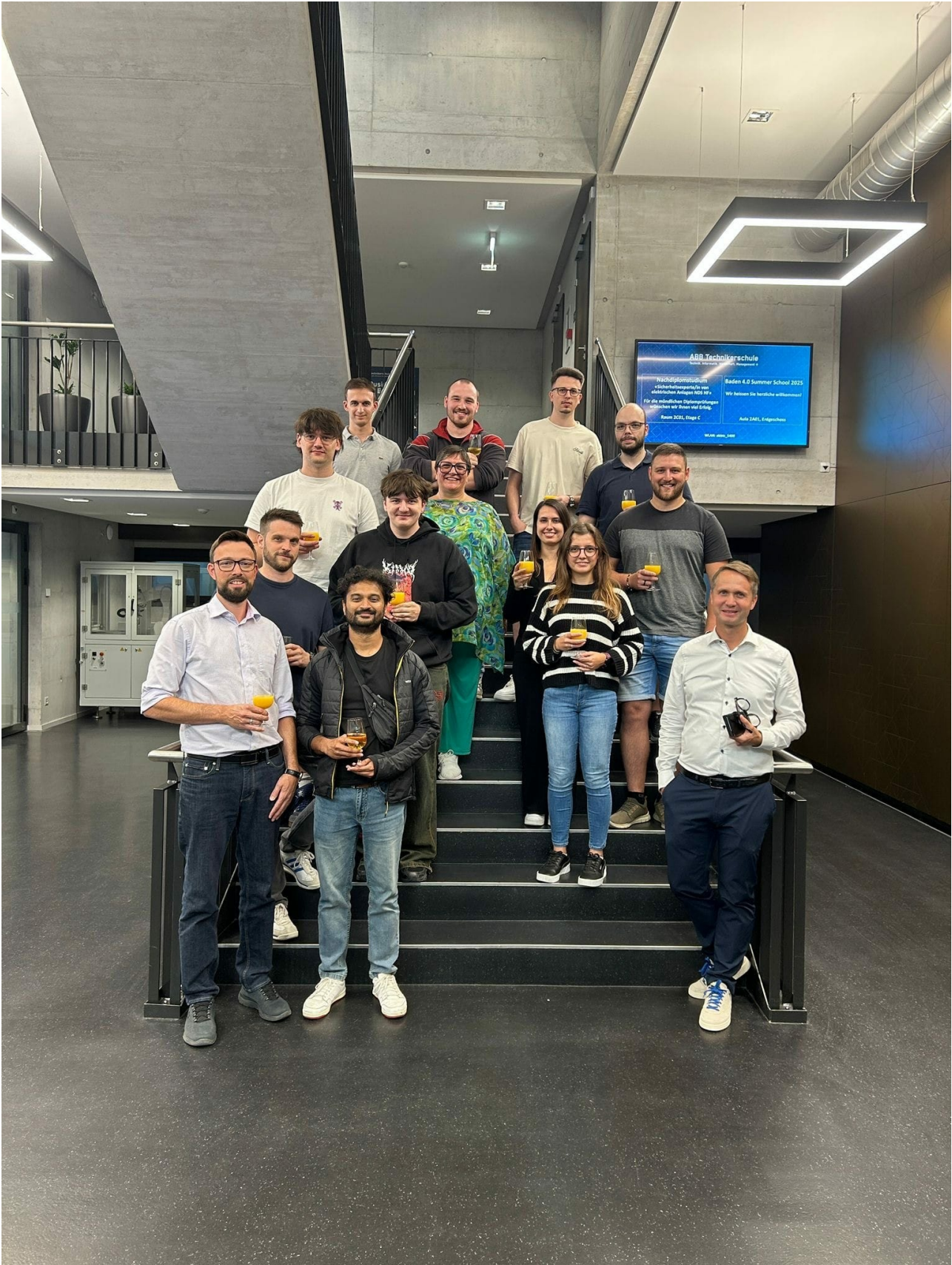
Bildbeschreibung: Team-up für Wochen-Challenge