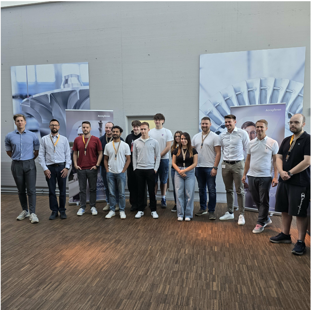
Bildbeschreibung: Einblick Cross-Ing