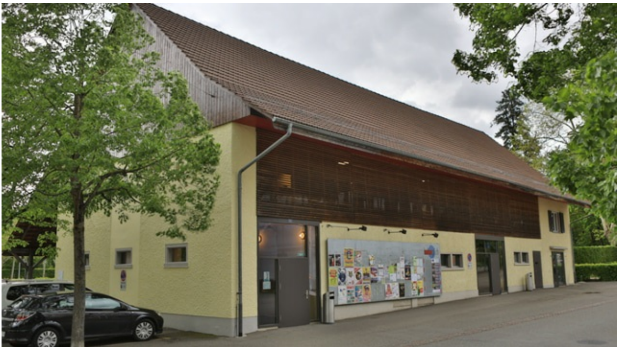
Bauernhaus an der Limmat Turgi