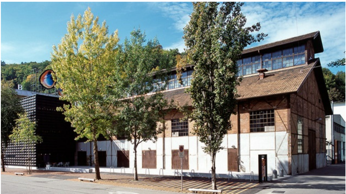
Kulturzentrum Alte Schmiede

Jugendkulturlokal Werkk, Halle alte Schmiede